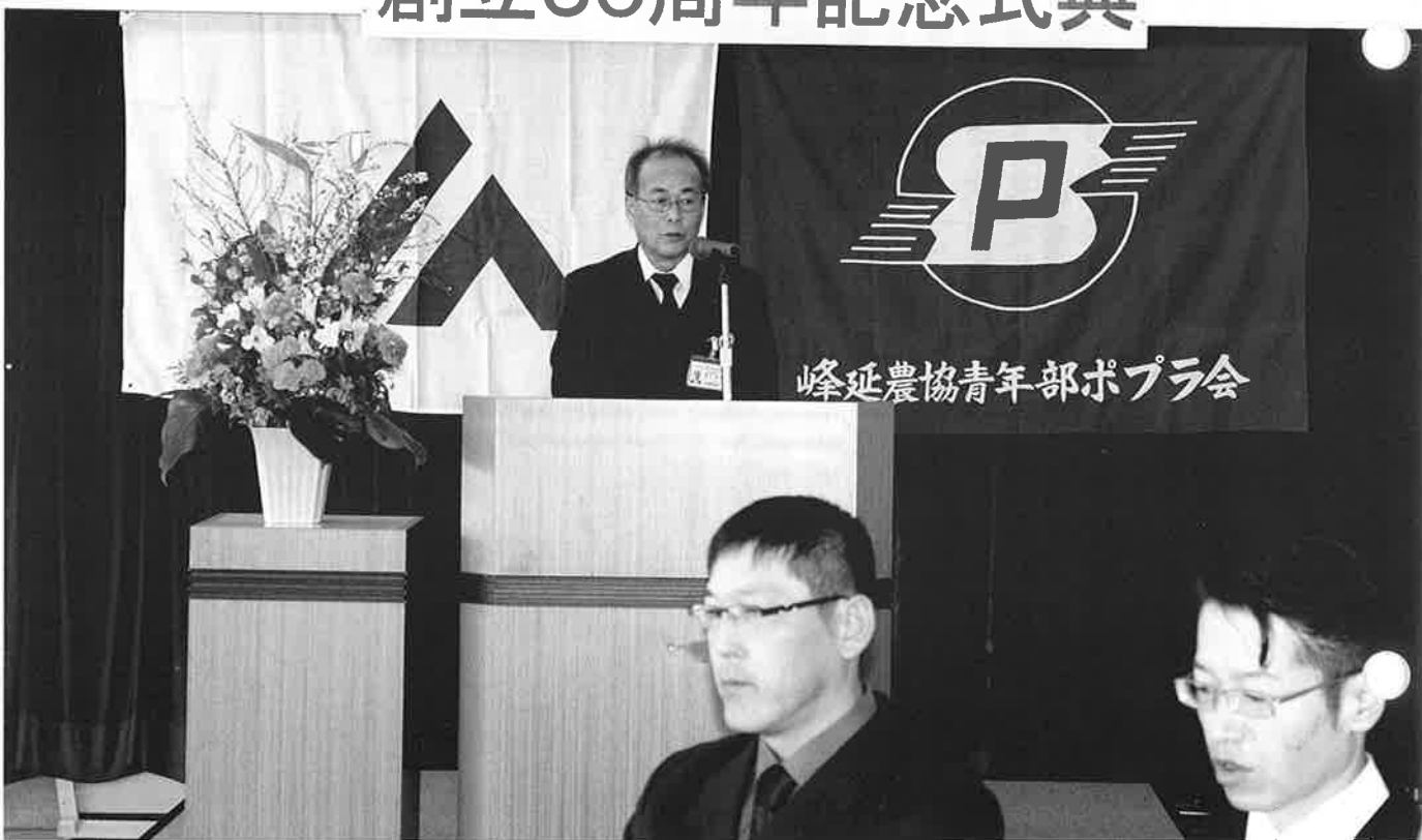
J A 青年部ポプラ会創立50周年記念式で祝辞を述べる森川組合長 (J A 三階会議室、2月22日)